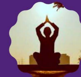
YOGA FOR PEOPLE WITH DIABETES Saturday; 11 to 12 pm

In addition to regular sessions, we also provide Bespoke Mentoring to individuals, Employment support, Beauty sessions, Personal development, Career/Professional development, CV/Interview skills, Footcare education workshops.