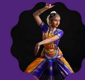
INDIAN CLASSICAL DANCE Friday 3 to 4 pm