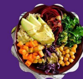
HEALTHY EATING Thursday 10:30 to 11:30 am