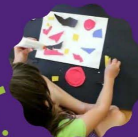
CHILDREN'S SESSION Wednesday 4:30 to 5:15 pm