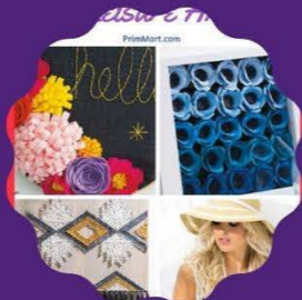
CREATIVE SESSION Thursday 1:30 to 2:30 pm