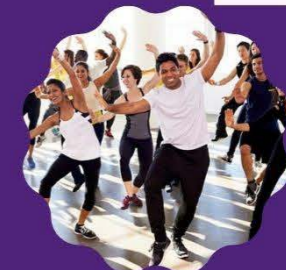
BOLLYWOOD FITNESS Tuesday 2 to 3 pm