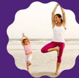
YOGA & Coffee Morning Monday to Friday 9:45 to 10:30 am

TMR supporting communities with mentoring services via Online