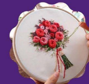
EMBROIDERY/SEWING Wednesday 12:30 to 1:15 pm