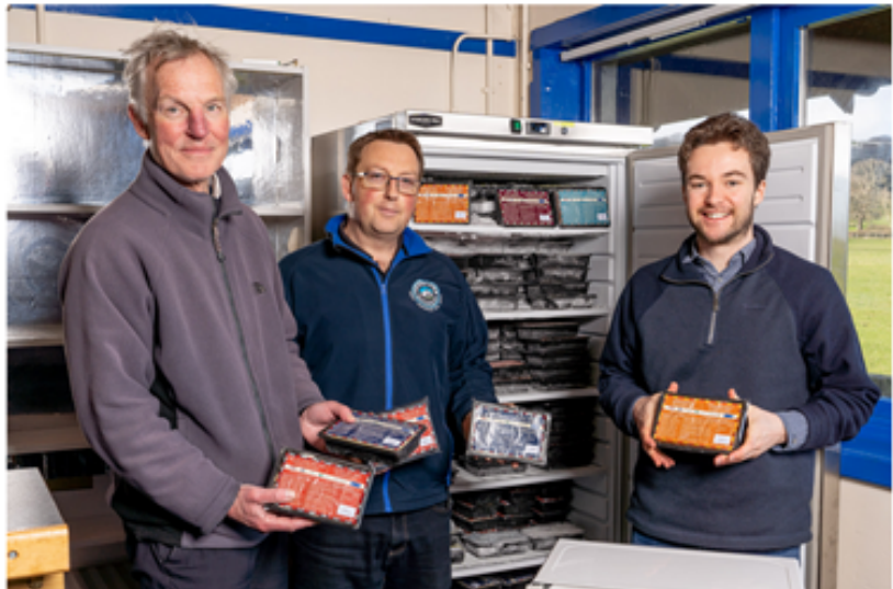
Community freezers combat food poverty